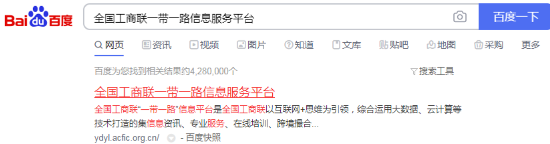
图 2 百度搜索“全国工商联一带一路信息服务平台”

请使用一带一路系统账号登录。登录方式：打开全国工商联一带一路信息服务平台网站 http://ydyf.acfic.org.cn/ 或百度搜索“全国工商联一带一路信息服务平台”，进入后点击“全国工商联一带一路数据库”进入。