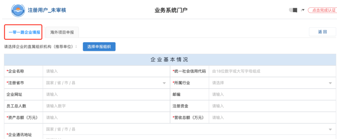
图 7 企业信息填报页面

点击【一带一路企业申报】系统菜单栏中的【一带一路企业填报】，进入企业信息填报详情页进行填报。