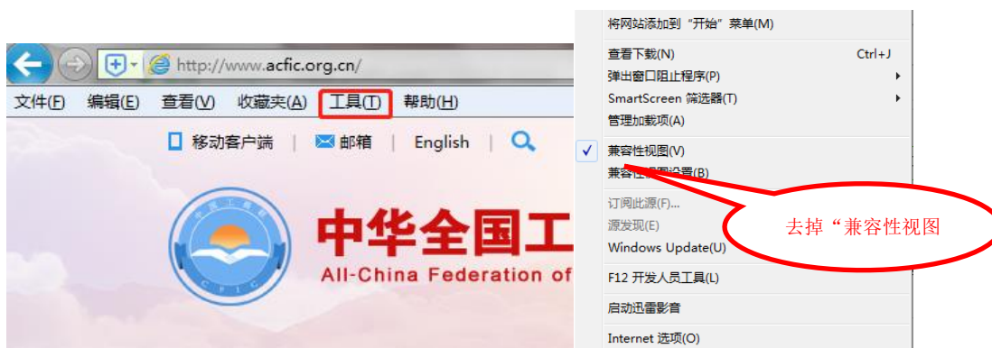
图 1 浏览器设置

IE10 以下版本浏览器会自动建议下载 Chrome 浏览器（谷歌浏览器），使用 IE10 浏览器和 IE11 浏览器用户需要按下图指示去掉“兼容性视图”的选勾。