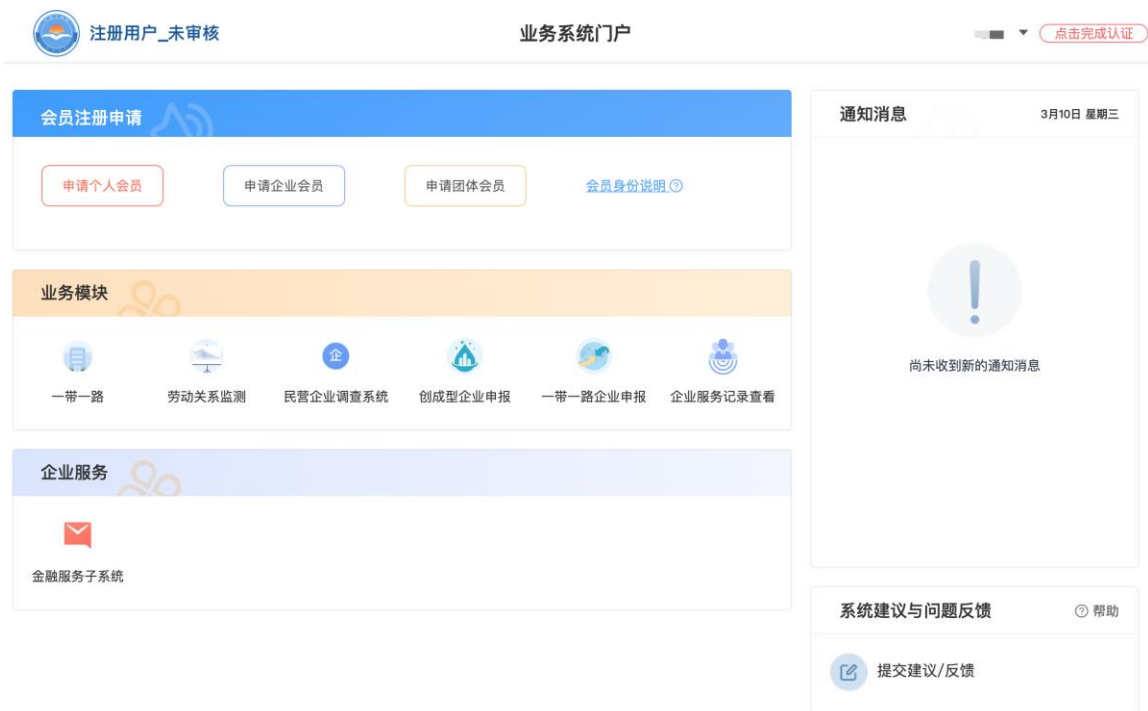
图 5 用户页面

用户登录后，进入业务系统门户，主要有个人资料管理、已授权的业务系统、系统建议与问题反馈模块。