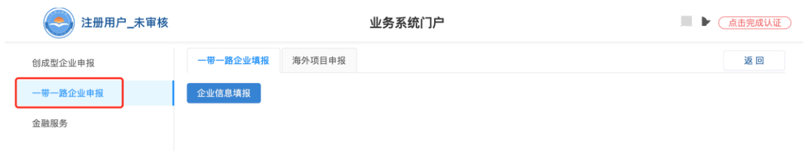
图 6 业务管理系统页面