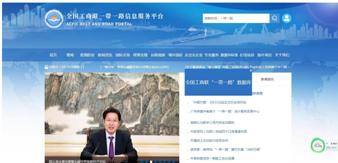
图 3 全国工商联“一带一路数据库”系统入口

点击密码登录，然后输入账号、密码登录系统。未注册用户，点击“立即注册”进行注册后登录。